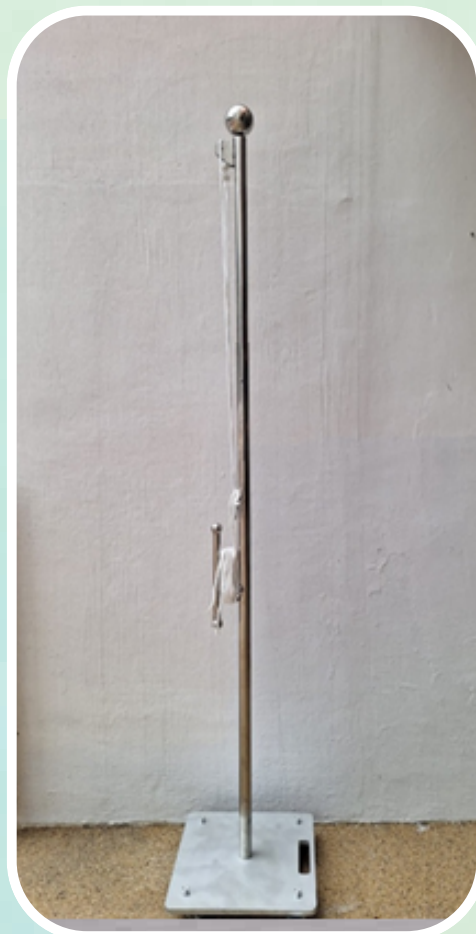
幼稚園流動旗桿全圖