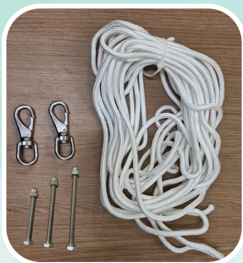
3. 配件：旗繩連旗扣、螺絲及絲帽